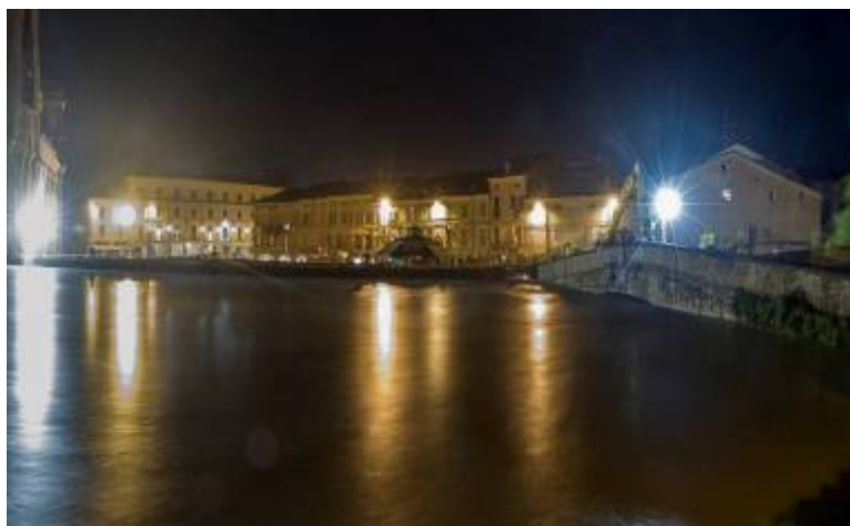
Fig. 3 - Alcune immagini della piena del T. Parma a Colorno

Nella frazione di Copernio sono stati allagati gli edifici posti in zona golenale ed evacuate 2 famiglie.