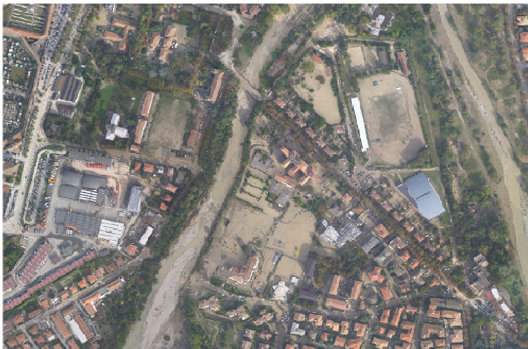
Fig. 1 - Alcune immagini dell'alluvione del 13 Ottobre a Parma

E' stata garantita l'assistenza sociale e sanitaria domiciliare mediante visite mediche distribuzione di pasti alle persone dei quartieri privi di gas ed elettricità, è stata attivata la distribuzione di beni necessari ad anziani e disabili non autosufficienti, coperte e candele alle famiglie circa 40 che a seguito della ricognizione fatta sul territorio hanno evidenziato questo bisogno. Sono stati assicurati contatti con medici curanti e specialisti per necessità di tipo sanitario per 7 nuclei familiari, ed il raccordo tra volontari che si sono direttamente presentati al servizio e nuclei familiari con fragilità sociale che, sempre nella ricognizione sul territorio, hanno fatto esplicita richiesta di aiuto.