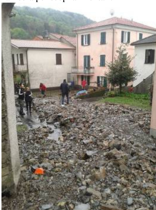
Fig. 2 - Alcune immagini della località Alpe (Bedonia)

In località Alpe inoltre si sono stati riscontrati danni all'acquifero della sorgente e alla relativa struttura di captazione alimentante l'acquedotto nonché all'acquedotto. L'intrbidimento delle acque potabili ha richiesto l'emissione di Ordinanza del Sindaco di divieto di utilizzo della risorsa per scopi alimentari.