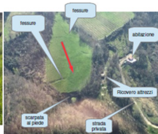
Comune di Casola Valsenio - frana di Meleto loc. Ronchi