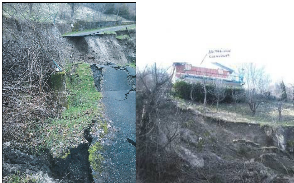
Comune di Coli – S.C. Rampa-Ruei

Sempre a causa di dissesti sono state interrotte le strade comunali per le frazioni Predalbora e Querciaccia con n. 2 isolamenti (1 persona a Predalbora e 1 persona a Querciaccia). E' stato effettuato un intervento del comune per il ripristino del transito mediante allargamento della carreggiata sul lato monte.