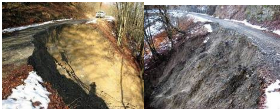
Farini: dissesti sulle strade di Pradalbora e Querciaccia

Sempre a causa di dissesti sono state interrotte le strade comunali per le frazioni Predalbora e Querciaccia con n. 2 isolamenti (1 persona a Predalbora e 1 persona a Querciaccia). E' stato effettuato un intervento del comune per il ripristino del transito mediante allargamento della carreggiata sul lato monte.