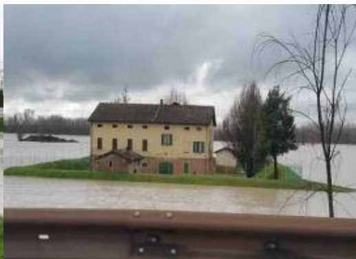
Fiume Secchia a Campogalliano

Si sono verificati erosioni arginali del Cavo Levata a Bastiglia, del Tiepido a Modena e a Campogalliano, allagamenti a del Torrente Taglio a Castelnuovo Rangone e del Torrente Grizzaga in località Montale; del Torrente Guerro a Castelvetro e in loc. Cà di Sola, Si sono inoltre seriamente danneggiate opere idrauliche: la traversa a valle di ponte Veggia sul Secchia nei comuni di Sassuolo e Catellaro e della traversa di Zenzano sul F Panaro nei comuni di Savignano sul Panaro e Marano.