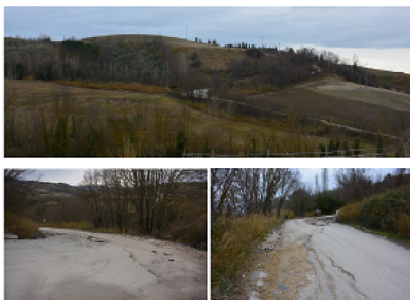
Comune di Coriano- Via Ranco loc. Mulazzano

Si è riattivato un dissesto che ha interessato la strada comunale Via Ranco (loc. Mulazzano), interdetta al transito.