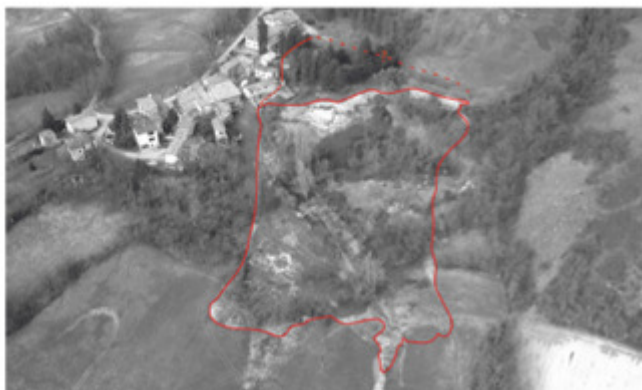
Comune di Traversetolo – frana di Gavazzo

Si è verificato l'aggravamento delle condizioni d'instabilità della pendice su cui sorge l'abitato di Gavazzo, con un'accelerazione dei movimenti registrati dalla rete di monitoraggio da 0,2 mm/giorno (1 Gennaio - 27 Febbraio) sino a 2,0 mm/giorno attuali. La frana interessa direttamente il centro abitato, la viabilità, un elettrodotto e il T. Termina