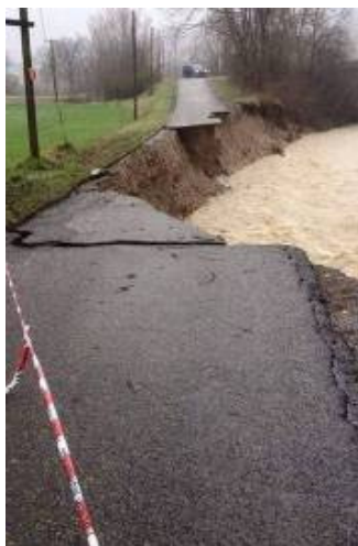
Gropparello – T. Riglio, strada comunale di Veggiola

Fortemente compromessa a causa dell'attivazione e della riattivazione dei dissesti la viabilità provinciale e comunale.