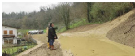
Comune di Dovadola – Le Trove