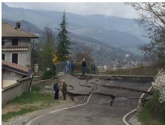
Bettola- frana in loc. Pergalla che interessa la SP 15 ed alcune abitazioni

In comune di Bettola, loc. Pergalla, il 26 marzo una frana di 400 metri di lunghezza, 300 di larghezza e alcune decine di metri di profondità ha interessato la SP 15 e alcune abitazioni. Risultano inagibili e severamente danneggiate diverse strutture abitative e ad uso agricolo, la necessaria conseguente chiusura della SP è causa di gravissime difficoltà di comunicazione delle frazioni interessate.