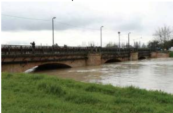
Fiume Secchia a Ponte Alto

A Modena come misure precauzionali sono state chiuse le scuole di Bastiglia, Bomporto e Sozzigalli di Soliera ed i ponti Alto, dell'Uccellino, di Navicello vecchio e di via Curtatona. Sono stati chiusi i ponti sul fiume Secchia e sul fiume Panaro.