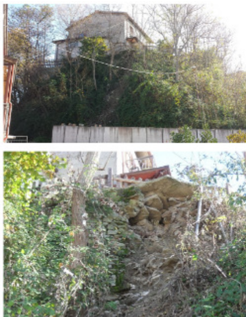
Comune di Sant'Agata Feltria- loc. San Donato