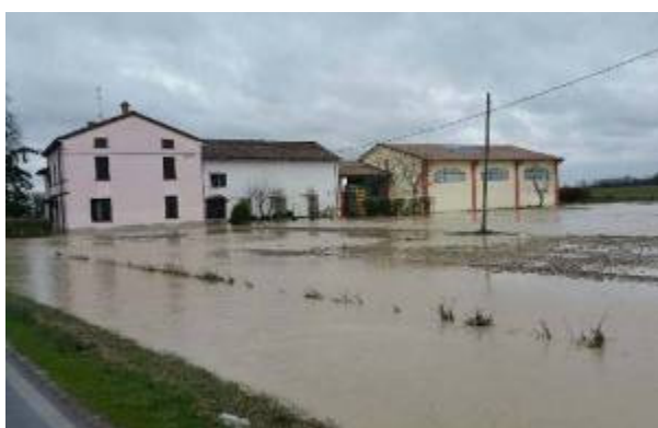
Torrente Arda a San Martino in Olza

Il torrente Chiavenna ha provocato diffuse esondazioni, con conseguenti allagamenti e chiusure di tratti stradali, danni alle opere di difesa idraulica, depositi di materiali in alveo e occlusioni parziale di sezioni di alveo, erosioni spondali, allagamenti di spazi pubblici. Interessate le località Chiavenna Landi di Cortemaggiore, La Chiusa, Saliceto e Rovoletto, Fontana Fredda, in comune di Cadeo; interessate alcune strade comunali del comune di Lugagnano e del comune di Castell'Arquato.