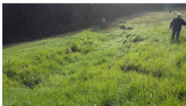
Particolare di una grande fessura situata nella parte bassa dell'area in frana.

Si è inoltre manifestata una frana di scivolamento traslativo (frana di Meleto) in località Ronchi, probabilmente attivata in corrispondenza di un interstrato marnoso, con una scarpata di distacco a monte e una serie di crepacciature. Il dissesto si sviluppa per blocchi fino al piede dove lo scivolamento di materiale detritico si riversa nell'alveo del rio.