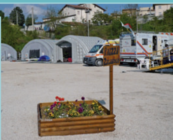
Campo di Accoglienza Sant'Eusanio Forconese