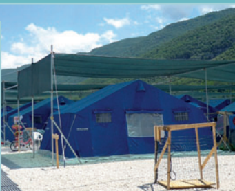
Campo di Accoglienza Villa Sant'Angelo