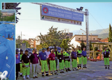
Campo di Accoglienza Piazza d'Armi