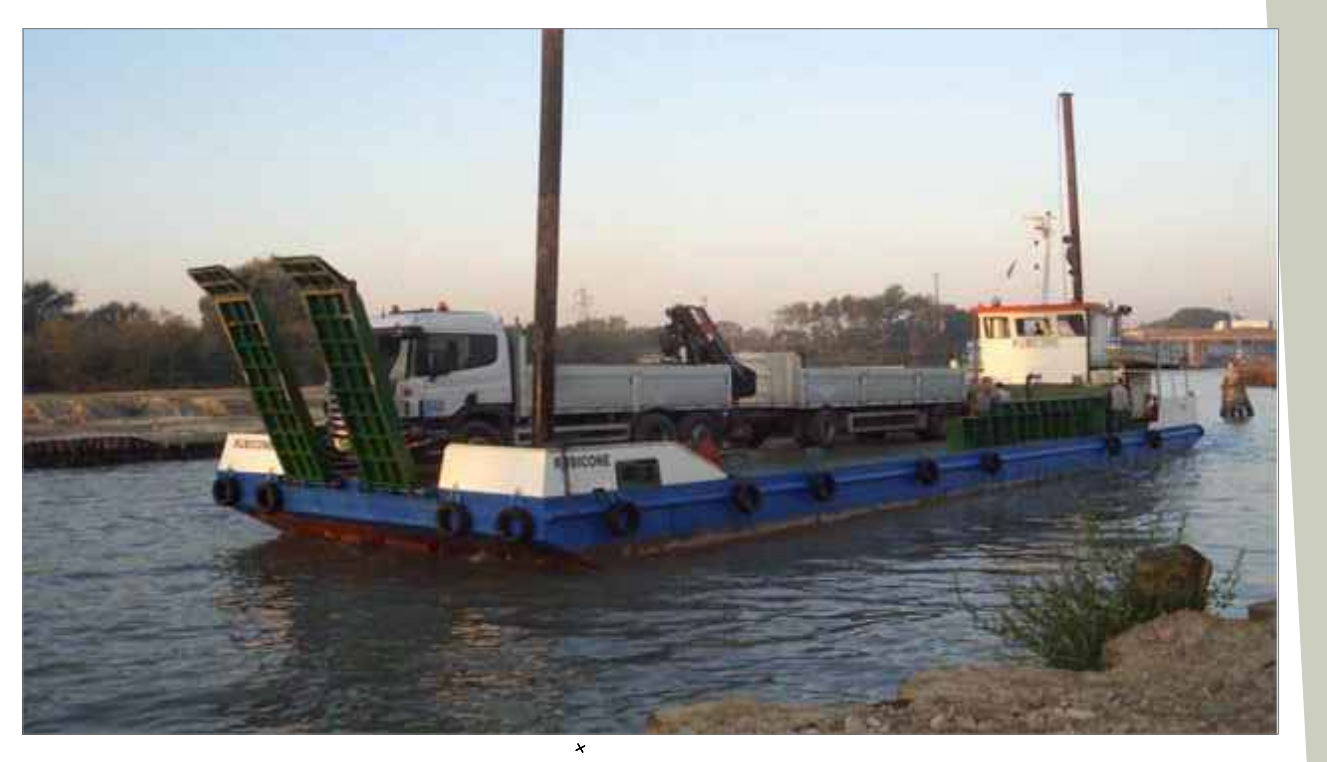
Po di Goro